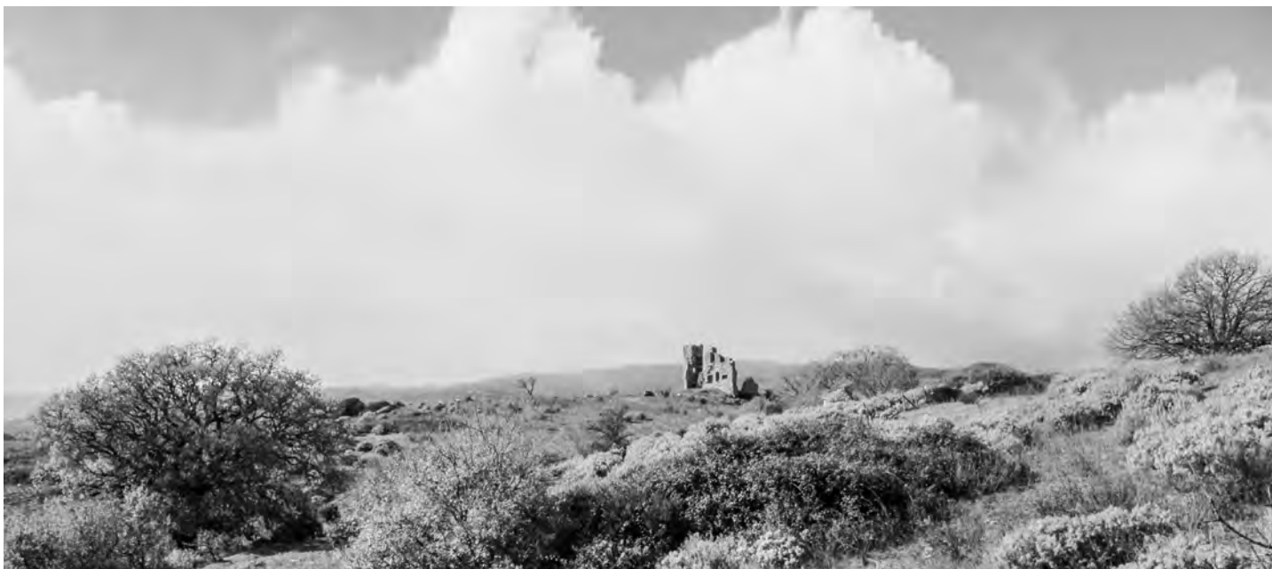
Fig. 1 Le «Vescovado» vu depuis l'est du promontoire

D'après l'analyse archéo-anthropologique des sépultures, nous pouvons conclure qu'un grand ensemble sépulcral de type cimetière a été installé à l'ouest du «Vescovado», ce qui suggérerait alors une fonction funéraire, voir religieuse du locus 1. Une partie des sépultures est recoupée par l'installation de plusieurs éléments architecturaux et indique une évolution (plutôt un rétrécissement) de cet édifice. La poursuite de la fouille des inhumations lors de la prochaine campagne nous permettra de compléter l'étude de cet espace et de vérifier si la partie au sud du mur M1019 est bien distincte du reste du cimetière.